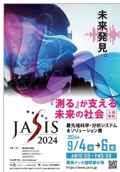
JASIS 2024 ポスター